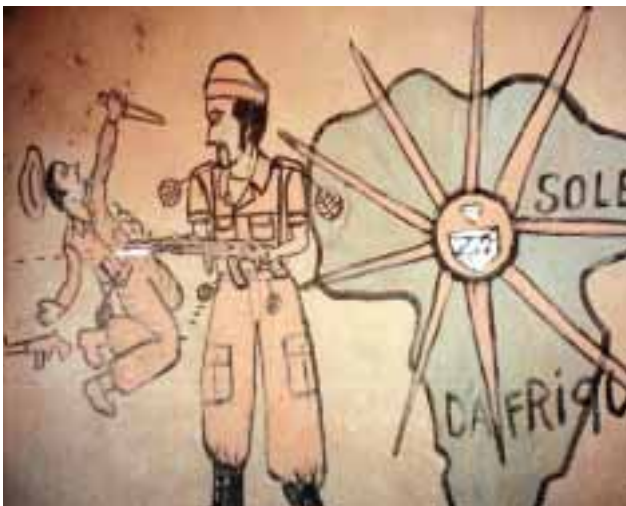
Les diamants ont alimenté des guerres dévastatrices dans plusieurs pays africains.

Non seulement les diamants exacerbent les guerres civiles, mais ils servent aussi au financement d'activités terroristes. En avril 2003, Global Witness a publié un rapport intitulé « For a Few Dollars More, How Al-Qaida Moved Into the Diamond Trade ». 3 Ce rapport révèle qu'Al-Qaida s'est infiltré dans les réseaux du commerce de diamants, tirant ainsi parti des structures utilisées par le commerce illicite, de la faiblesse des réglementations gouvernementales et commerciales, des réseaux de crime organisé et des régimes politiques corrompus pour recueillir les fonds nécessaires à ses opérations et blanchir des sommes considérables. Le rapport repose sur plusieurs articles rédigés en novembre 2001 par Doug