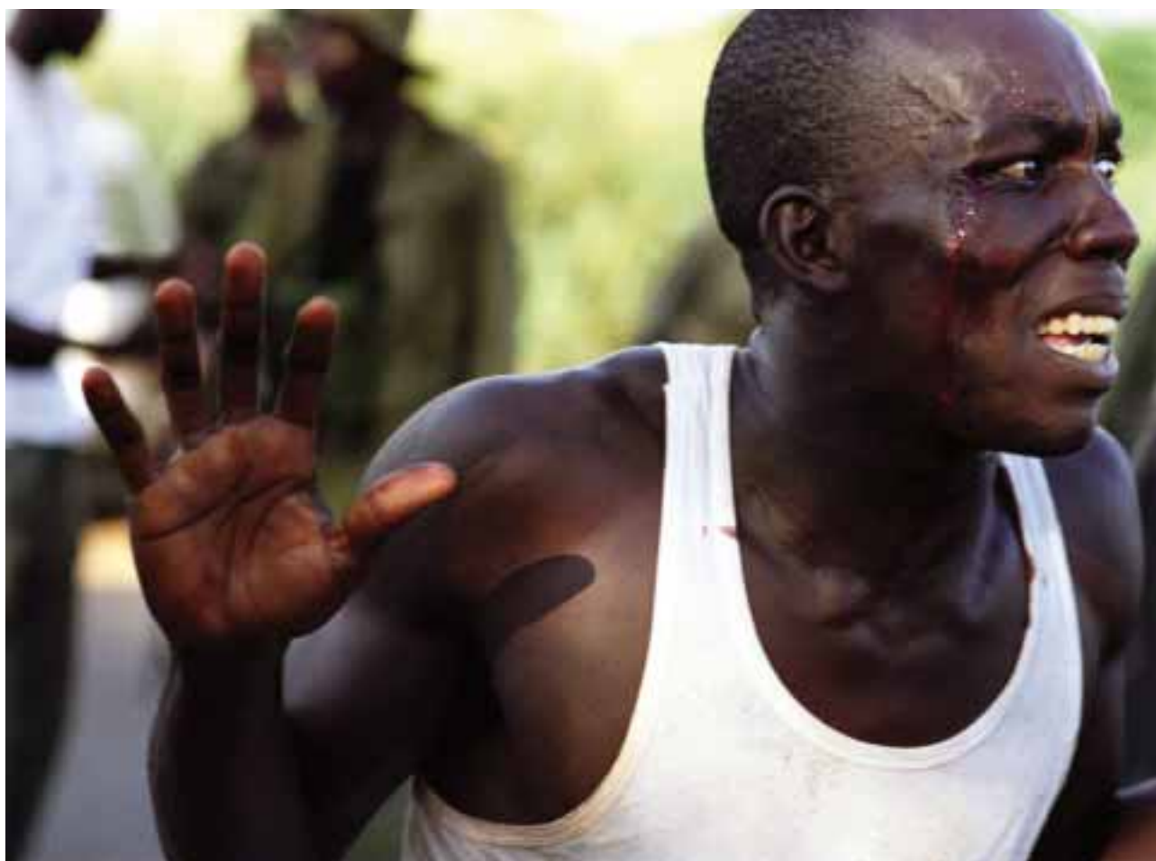
Un homme arrêté à un barrage routier des Forces nouvelles en octobre 2002.