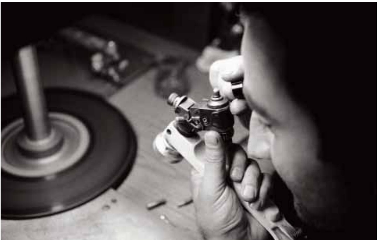
Les usines de diamants effectuent un suivi des diamants qu'elles traitent, et les autorités doivent effectuer un suivi de ces usines.

Dans les grandes usines que Global Witness a visitées, chaque diamant qui entre dans la chaîne de fabrication reçoit un « passeport » qui recense ses caractéristiques particulières et le rendement idéal attendu. 154 Le passeport enregistre chaque étape du processus de fabrication, depuis l'évaluation jusqu'au moment où le diamant poli est trié et emballé pour être exporté. Les détails sont vérifiés après chaque étape du processus pour veiller à ce que le diamant atteigne un rendement maximum. Le passeport comprend une description individuelle et un croquis de la pierre qui servent également de contrôle de sécurité pour empêcher les diamants d'être intervertis lors de la taille. Une fois le