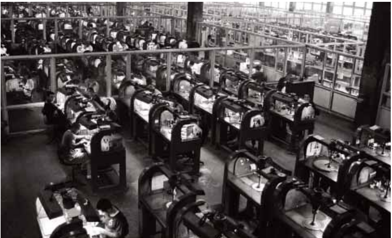
Le Processus de Kimberley devrait élaborer une série de meilleures pratiques destinées au mécanisme de contrôle gouvernemental des usines de taille et de polissage de diamants.

En septembre 2005, Global Witness a mené une enquête en Arménie, un centre de taille et de polissage en pleine croissance et signataire du Processus de Kimberley, pour voir si les mécanismes de contrôles internes du pays parvenaient à prévenir le commerce illicite des diamants. Ce type de commerce constitue une violation des lois nationales et permet d'illustrer la manière dont les diamants du conflit peuvent échapper au contrôle du Processus de Kimberley. Global Witness a interrogé les autorités arméniennes et les représentants d'usines ainsi qu'un large éventail de représentants d'organisations locales et internationales en Arménie. Le Processus de Kimberley devrait élaborer une série de meilleures pratiques destinées au mécanisme de contrôle gouvernemental des usines de taille et de polissage de