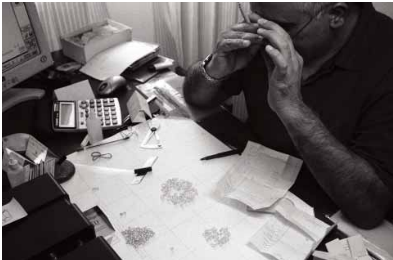
Expert-évaluateur dans une usine de polissage de diamants en train d'évaluer des diamants bruts avant leur traitement. Les autorités devraient également se doter de ce type de compétences techniques.

Se basant sur les résultats recueillis en Arménie et en Afrique de l'Ouest, ainsi que sur les informations collectées lors de plusieurs visites d'examen, Global Witness appelle le Processus de Kimberley à se pencher davantage sur les éventuels problèmes concernant les centres de taille et de polissage susceptibles d'être exploités par les négociants en diamants du conflit. Le Processus de Kimberley devrait élaborer une série de meilleures pratiques dédiées aux contrôles menés par les autorités dans les centres de taille et de polissage et demander instamment à ses participants de les mettre en œuvre.