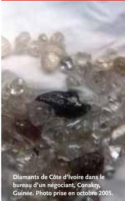
Diamants de Côte d'Ivoire dans le bureau d'un négociant, Conakry, Guinée. Photo prise en octobre 2005.

Lors d'enquêtes menées en Afrique de l'Ouest en septembre 2005, Global Witness a eu connaissance d'éléments suggérant que des diamants ivoiriens seraient exportés depuis la Guinée. Un important exportateur de diamants basé en Guinée a appris à Global Witness qu'on lui apportait régulièrement de grosses quantités de diamants ivoiriens dans son bureau de Conakry et ce, jusqu'à environ six mois auparavant. 30 D'autres négociants en diamants ont affirmé ne pas voir passer beaucoup de diamants ivoiriens à Conakry, bien qu'on leur en propose de temps en temps. 31 En Sierra Leone, l'agent d'un exportateur de diamants a déclaré travailler avec des acheteurs qui se rendent au Liberia pour se procurer des diamants ivoiriens. 32