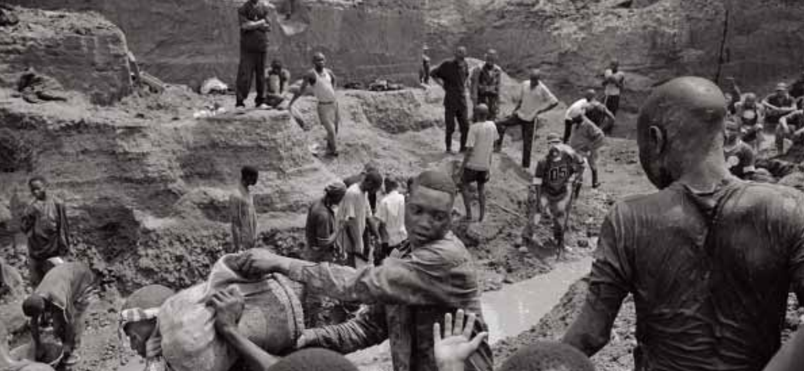
Mineurs de diamants artisanaux en République démocratique du Congo.