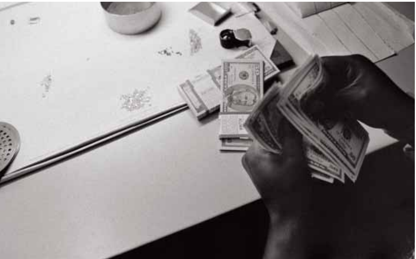
Kadir van Lohuizen

Avant la mise en place du Processus de Kimberley, les diamants empruntaient la voie la plus directe pour atteindre les marchés et étaient exportés à partir des pays de toute la région. Les frontières imposées par les anciennes puissances coloniales ne sont pas toujours reconnues par les populations locales, qui entretiennent parfois d'étroites relations ethniques, familiales ou tribales avec celles vivant de l'autre côté de la frontière. Des négociants venus de tous les pays d'Afrique de l'Ouest se rendent d'une zone d'exploitation diamantaire à une autre, achetant et vendant des diamants en fonction du marché, et de leurs relations. Certains ont ainsi tendance à soutenir les opérations d'extraction d'un pays particulier, dont ils vendent la production dans un pays voisin. 55