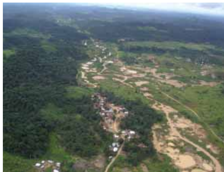
L'exploitation de diamants artisanaux est notoirement difficile à contrôler. Des mines peuvent se trouver dans des champs et le long des rivières.

Ce chapitre ne recense pas de manière exhaustive tous les problèmes liés aux mécanismes de contrôles internes des pays d'extraction artisanale de diamants. Il s'applique plutôt à donner les grandes lignes des résultats de