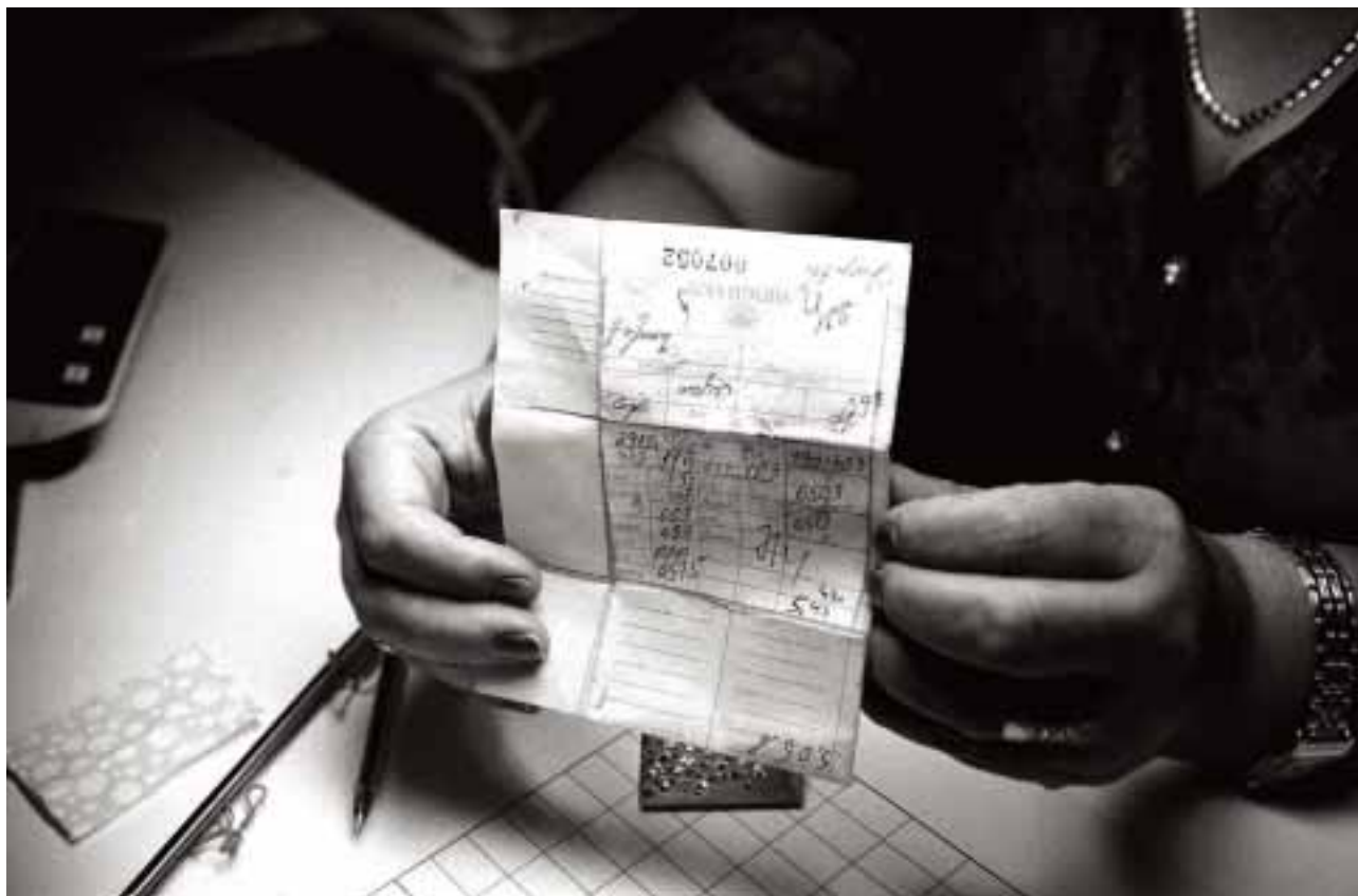
Certaines usines de polissage de diamants créent un « passeport » pour chaque pierre, sur lequel figurent les détails relatifs à chaque étape du traitement.

Les douanes arméniennes coopèrent avec le GJD et sont tenues en vertu de la loi d'avertir l'autorité chaque fois que des diamants bruts sont déclarés à l'importation. 149 L'aéroport international de Zvartnots, situé juste à l'extérieur de la capitale arménienne Erevan, est le seul