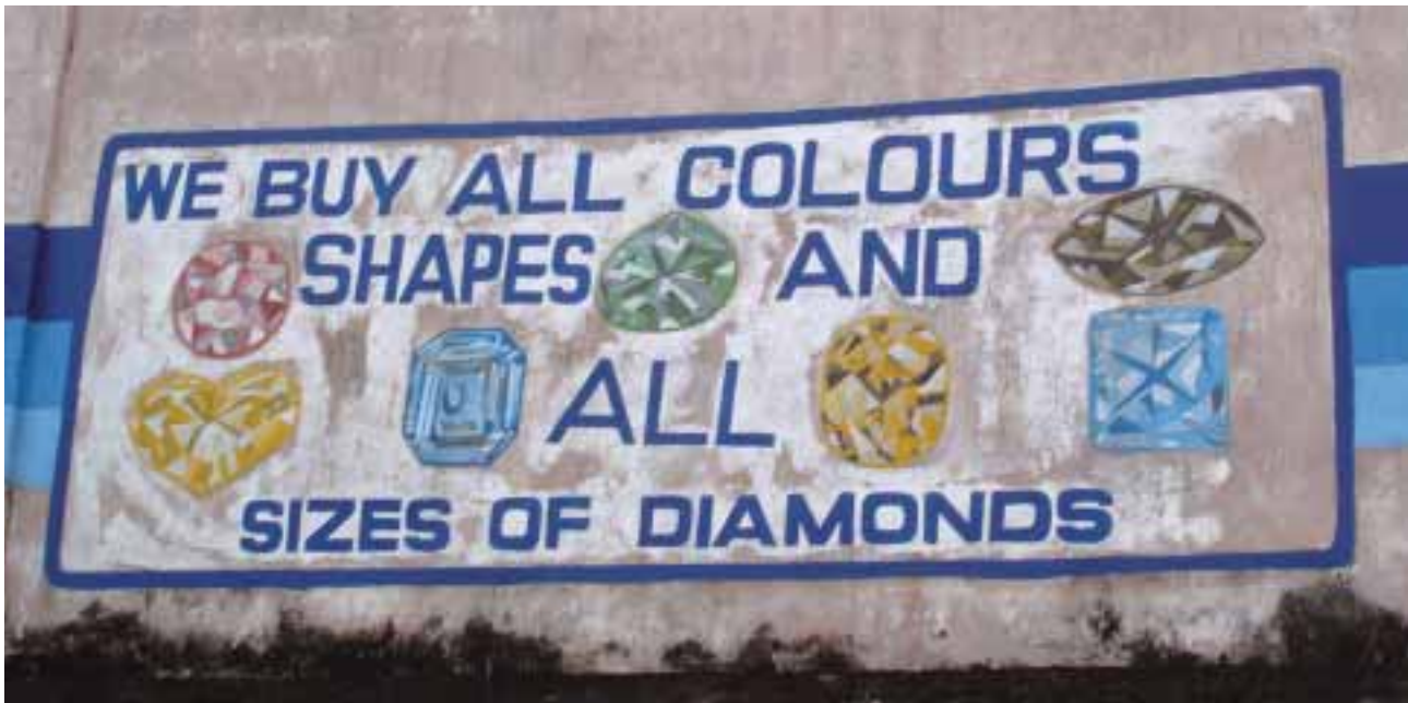
Des contrôles doivent être mis en place à tous les niveaux de la filière diamants – de la mine au centre de polissage.

exigences figurant dans l'accord (y compris poids en carats, valeur, mesures mises en place pour assurer l'inviolabilité et l'infalsifiabilité des diamants, et pays d'origine). 7 Cependant, le respect de ces systèmes n'est généralement pas vérifié sur le terrain avant que le pays soit admis à participer au Processus.