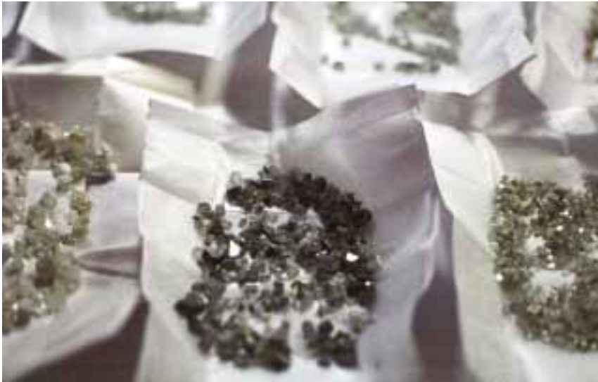
Des diamants bruts connus sous le nom de « marchandise indienne » à Surat, en Inde.

sa possession, il pouvait toujours soudoyer les autorités frontalières pour qu'elles le laissent passer. 62