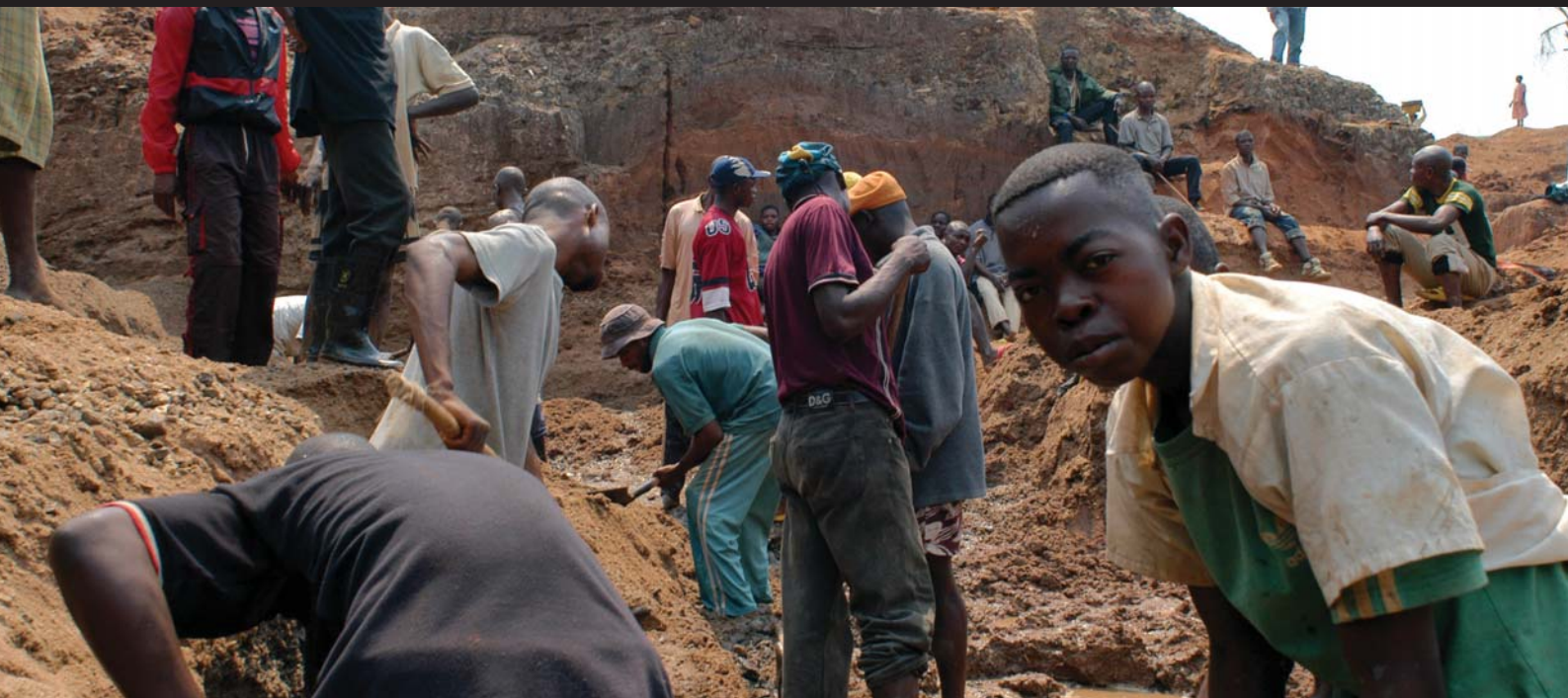
Creuseurs de diamants artisanaux à Mbuji Mayi, RDC.