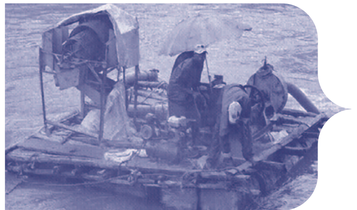
Plateforme de plongée en Angola

Les populations locales peuvent être déplacées et réinstallées de manière obligatoire, avec compensation. En principe, elles doivent être relogées par le concessionnaire selon les mêmes critères, et toutes les infrastructures sociales communautaires, y compris les écoles et les services d'approvisionnement en eau, doivent être fournies dans une même mesure. Le gouverneur de la province doit approuver toute réinstallation proposée.