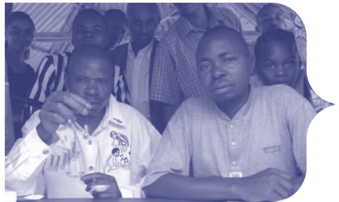
Des négociants qui présentent les diamants en RD Congo

En 2002, Amnistie Internationale a documenté l'arrestation et la fusillade de douzaines de mineurs artisanaux travaillant illégalement dans la zone de concession de la MIBA 28 . La MIBA a une concession de 78 000 km 2 et exploite 12 pipes kimberlitiques dans une petite section de cette zone appelée le Polygone. Lorsque le Polygone a été exploité pour la première fois, une clôture a été érigée tout autour pour empêcher les creuseurs illégaux d'y entrer, mais la clôture est brisée depuis près de 10 ans et la MIBA a bien de la peine à protéger cette zone. Des villages sont installés tout le long de la limite du Polygone et, en raison du manque d'emplois de rechange, les mineurs artisanaux entrent dans la zone – surtout la nuit – pour creuser, à la recherche de diamants. La MIBA possède sa propre force de sécurité, sans compter les policiers et les militaires sur place.