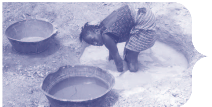
Extraction artisanale de l'or en Guinée

Sanimuso montre que les mineurs peuvent, dans une structure artisanale, être des entrepreneurs et recevoir un juste prix pour leur travail. Il n'y a pas de titulaires de permis, pas de négociants, pas de bailleurs de fonds et pas d'agents. Le mineur fait simplement son travail et vend l'or à la coopérative, qui agit comme intermédiaire et garantit un prix équitable.